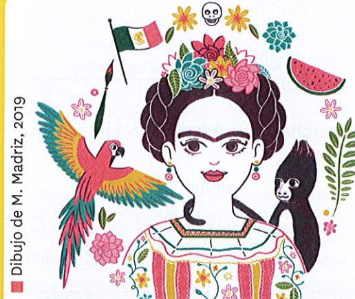
Dibujo de M. Madrid, 2019

Frida Kahlo fue una gran pintora 1 mexicana. Vivió 2 durante una época de grandes cambios 3 en México y en el mundo, y se casó 4 con Diego Rivera, otro famoso pintor mexicano.