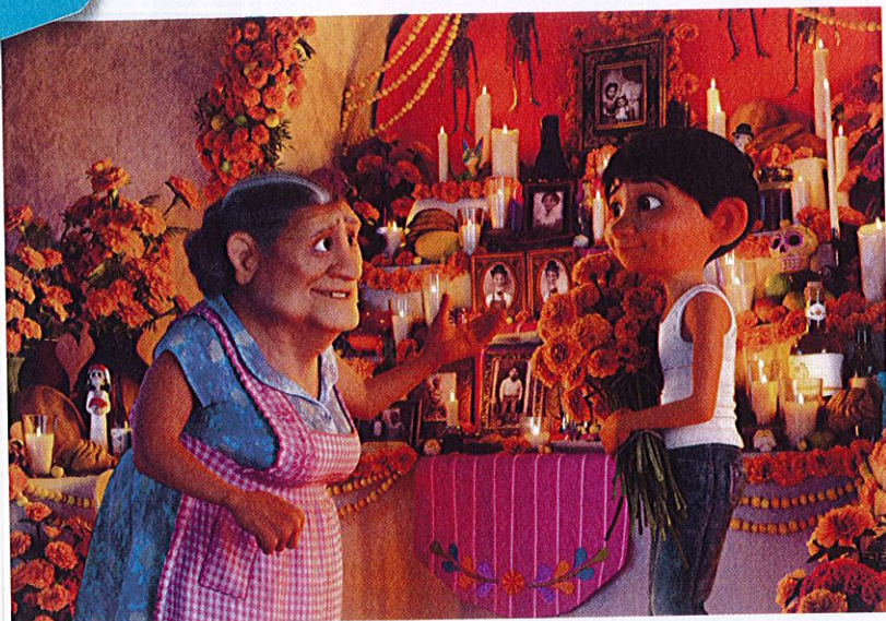
Fotograma de la película Coco, 2017