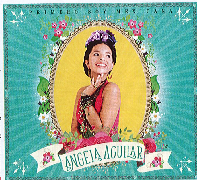
Album de Ángela Aguilar, Primero soy mexicana, 2018